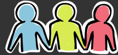
Ältere Schüler (14-16)